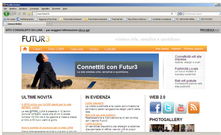
fig. 2 – Screenshot pubblicità interstiziale DINAMICA – sito, pagina web

L'inserzionista comunica a futur3 un url internet a sua scelta (ad esempio http://www.nomeazienda.it oppure http://www.nomeazienda.it/promozione/prodotto.html ) che viene caricato dal sistema LUNA interADS. A questo punto, l'inserzionista è libero di inserire all'interno dell'url comunicato qualsiasi informazione ritenga strategica. Così facendo ha inoltre la possibilità di cambiarlo in qualsiasi momento e in tempo reale.